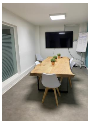
Salle de réunion