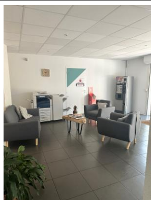
Hall d'entrée - vue 2